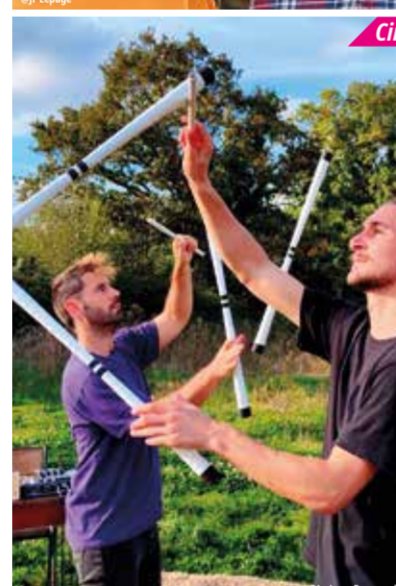
Cirque, acrobatie, burlesque

Deux apiculteurs allaient réaliser leur rêve : une maison dans la nature, un environnement sain pour eux et les abeilles. Malheureusement, une fois sur place, il faut se rendre à l'évidence : pas de maison, ils se sont fait escroquer... Sans argent, loin de chez eux, nos deux malchanceux ont une idée : ils vont créer des numéros avec ce qu'ils ont sous la main, un cirque domestique et ménager qu'ils appelleront « les moyens du bord ». C'est idiot, dangereux, poétique, maladroit, mais c'est avec conviction qu'ils donneront le meilleur pour ne pas se retrouver à la ru(Ch).