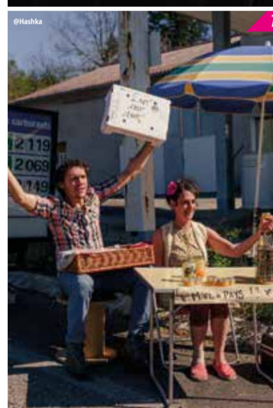
Théâtre de rue