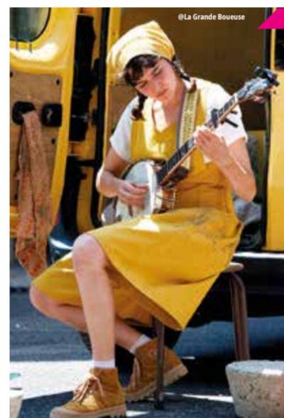
Théâtre de Rue

Nous vous invitons à vivre cette aventure le matin et nous vous garantissons que ce sera l'une des plus belles façons de commencer votre journée !