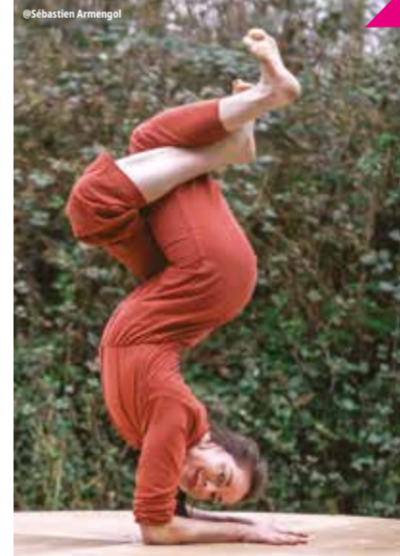
Documentaire et contorsion

Une poétesse rapporte une histoire qu'elle a entendue au fin fond du Tennessee. Une vieille française a disparu dans le Mississippi, dévorée selon une croyance locale par les Muddy Worms, esprits du fleuve. Le temps de ce parcours géographique au ton décalé, la poétesse construit à ciel ouvert un monument funéraire en terre, avec la vase de l'estuaire de la Gironde, lieu qui est aussi le point de départ de la fable. Geste verbal et architectural font spectacle et sont ponctuellement accompagnés de ritournelles au banjo, instrument associé au colportage d'histoires.