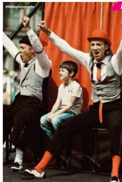
Duo Cirque et Clown

Spectacles Gratuits Chapeau de soutien aux Renc'Arts