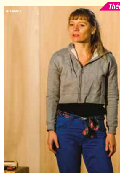
Théâtre-récit et danse

Un danseur de hip-hop de 21 ans et un comédien de 55 ans donnent corps et parole à 7 poèmes. Ensemble, ils découvrent comment se construire et se reconstruire, l'un par rapport à l'autre, quand l'un est jeune et l'autre plus âgé, quand l'un est un fils et l'autre un père. Dans 7 Samourais, chaque poème est une métaphore qui fait l'objet d'un véritable tableau en mouvement confrontant deux générations et deux moyens d'expression. Tous abordent la question de l'équilibre entre les valeurs et les actions, et du combat pour la reconquête perpétuelle de la liberté.