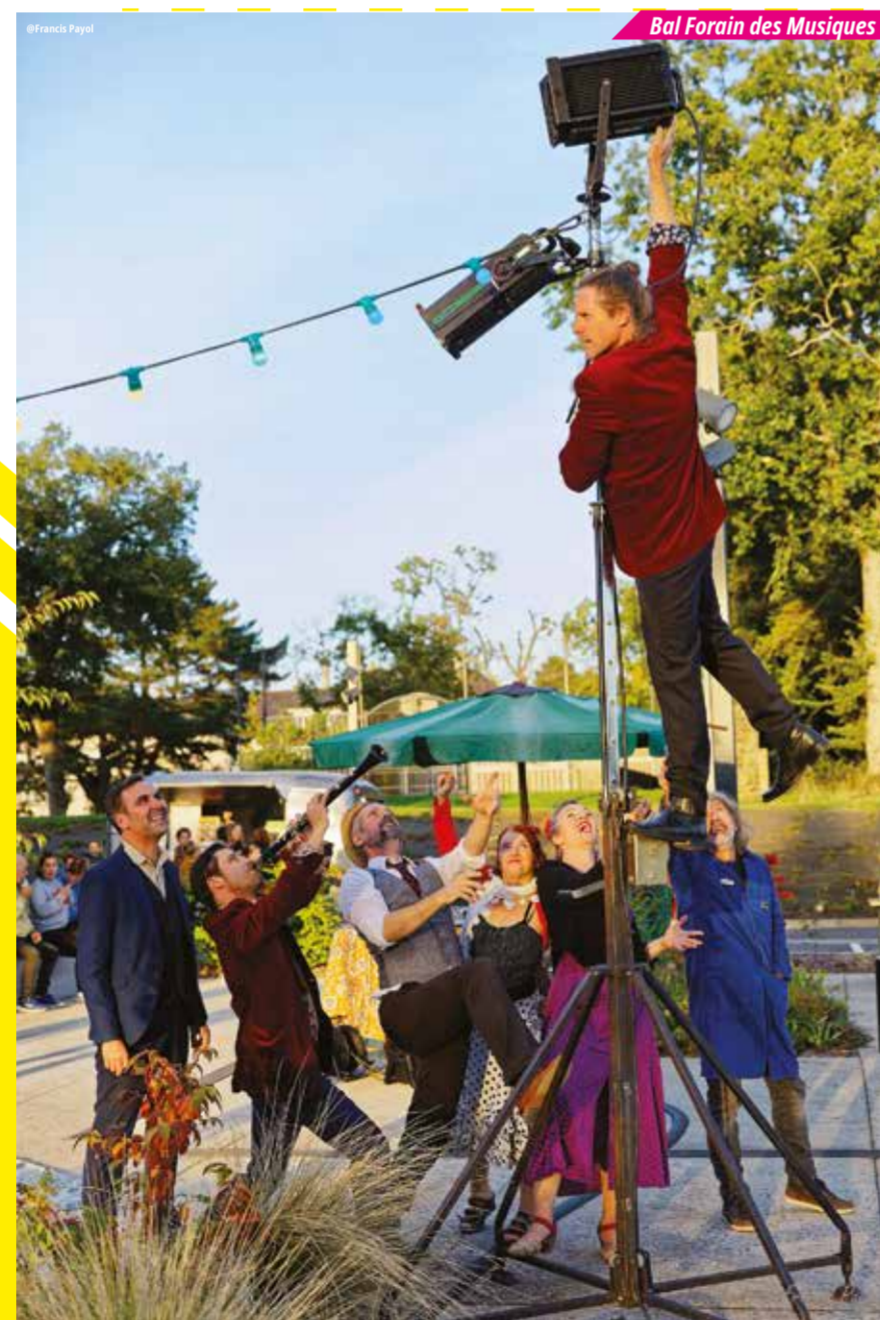
Bal Forain des Musiques du Monde

Un esprit de fête foraine mais des jeux qui se jouent avec les fesses. Deux jeux - La Cataculte et Le Souffle-Cul -, deux joueurs, trois bonimenteurs. Une ambiance conviviale, chaleureuse et pleine d'humour. Un jeu pour toute la famille et pour tous les types de fesses ! Alors venez vous amuser en notre compagnie !!