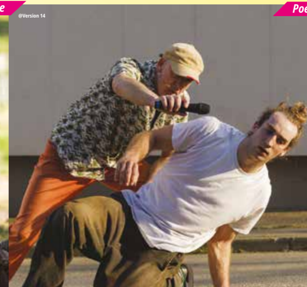
Poésie et danse Hip Hop

Ce garçon sera tiraillé entre cette obsession culinaire et son besoin profond : s'ouvrir aux autres. Malgré leurs différences, le public et le personnage devront s'apprivoiser et cette rencontre les mènera au-delà de leurs espérances pour la vie, la douce folie qui nous permet parfois de rester debout. Un spectacle drôle et émouvant.