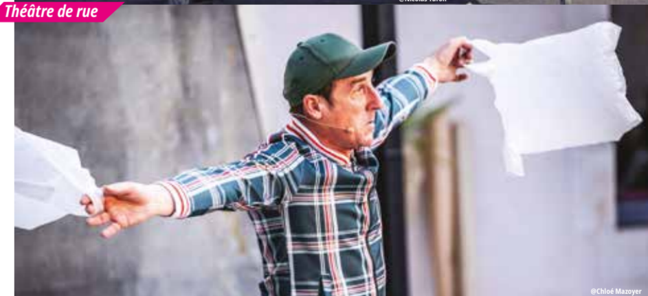
Théâtre de rue